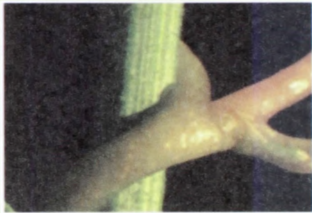
අග මුල නැති වැල් ධාරක ශාකය සමග ස්පර්ශ වන අයුරු